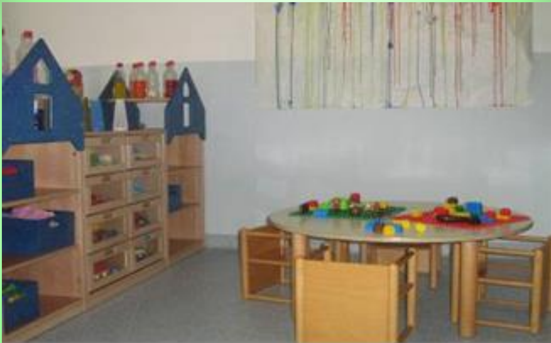
Spazi interni: angolo costruzioni