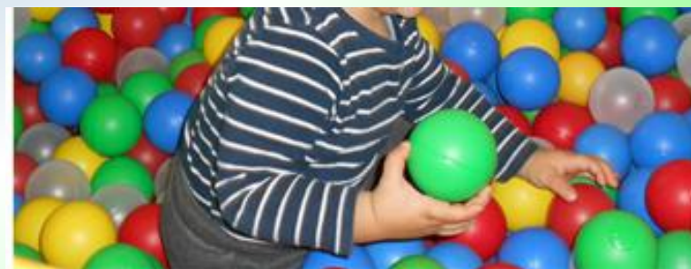
Spazi interni: angolo gioco motorio e palestra