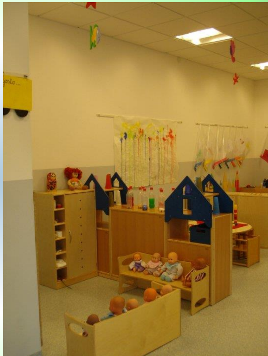
Spazi interni: angolo narrazione e angolo gioco simbolico bambole